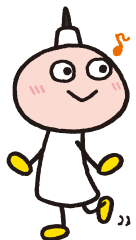
マスコットキャラクター たわわちゃん ©もへろん

JRや地下鉄とも直結しあらゆる交通アクセスに恵まれた場所は、京都旅の起点として最高のロケーションです。